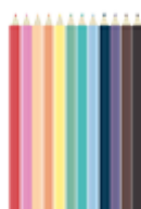
12 crayons de couleur