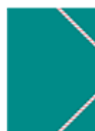
deux pochettes à rabats avec élastiques