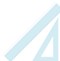
une règle 30cm et une équerre