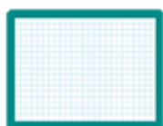
une ardoise blanche